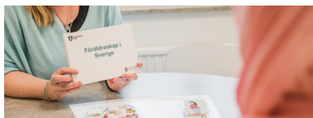
Föräldraskap i Sverige

ABC är gruppträffar för föräldrar med barn mellan 0-2 år samt 3-12 år. Träffarna har olika teman som berör familjeliv, konflikter, stress och andra utmaningar som hör vardagen till. Innehållet i materialet utgår från forskning kring föräldraskap och barns utveckling samt FN:s barnkonvention. Under träffarna får du möjlighet att ta del av andra föräldrars tankar, tips och erfarenheter.