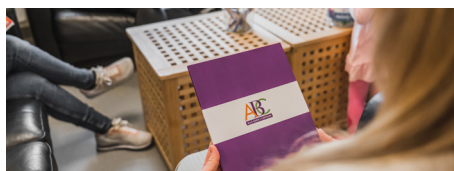
ABC- Alla barn i centrum

ABC är gruppträffar för föräldrar med barn mellan 0-2 år samt 3-12 år. Träffarna har olika teman som berör familjeliv, konflikter, stress och andra utmaningar som hör vardagen till. Innehållet i materialet utgår från forskning kring föräldraskap och barns utveckling samt FN:s barnkonvention. Under träffarna får du möjlighet att ta del av andra föräldrars tankar, tips och erfarenheter.