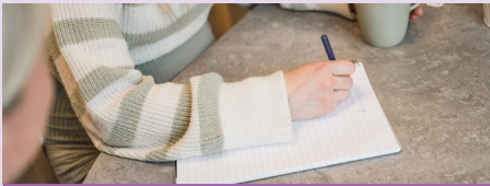
Föda utan rädsla

Föda utan rädsla är en utbildning som förbereder dig inför förlossningen och rekommenderas för dig i graviditetsvecka 26 och framåt. Vi utgår från fyra effektiva verktyg; andning, avspänning, rösten och tankens kraft. Både du som föder och din partner eller stödperson är välkomna att delta.