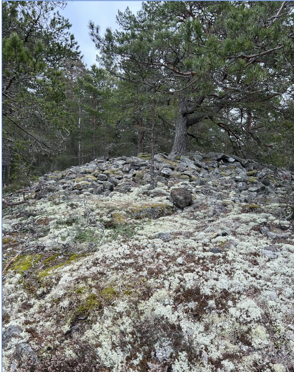
Figur 3. Det stora bronsåldersröset längst ut på den sydvästra udden. L2005:988. Intill röset påträffades två intilliggande konstruktioner. Antingen egna, intilliggande gravar, eller påbyggda konstruktioner.