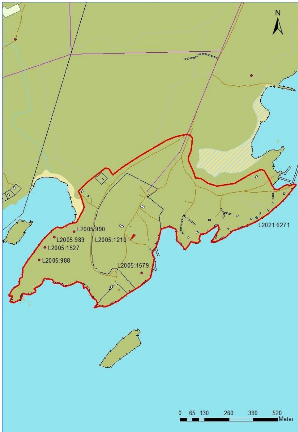
Figur 4. Kända lämningar inom utredningsområdet. Röd färg markerar utredningsområdet.