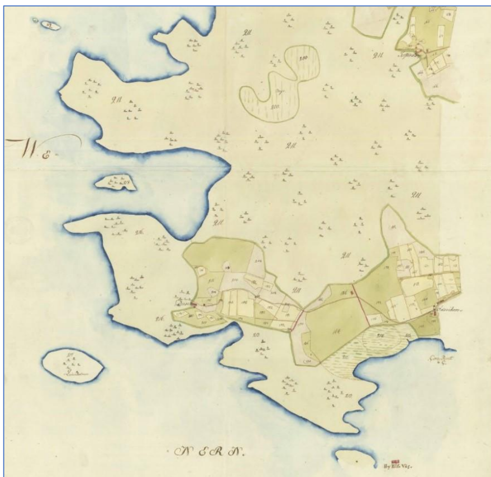
Figur 2. Utsnitt av 1798 års karta över Krokstad. Nära bildens mitt syns torpet Duse. LMS akt R12-19:2.

Syftet med kulturmiljöutredningen var att utreda om forn- eller kulturlämningar förekommer inom utredningsområdet. Objekt som eventuellt påträffats vid utredningen och som inte har den antikvariska statusen fornlämning värderas med Riksantikvarieämbetets modell "Plattform för kulturhistorisk värdering och urval" som utgångspunkt. I metoden utgår vi från fyra värderingsklasser: mycket högt kulturhistoriskt värde, högt kulturhistoriskt värde, kulturhistoriskt värde och visst kulturhistoriskt värde.